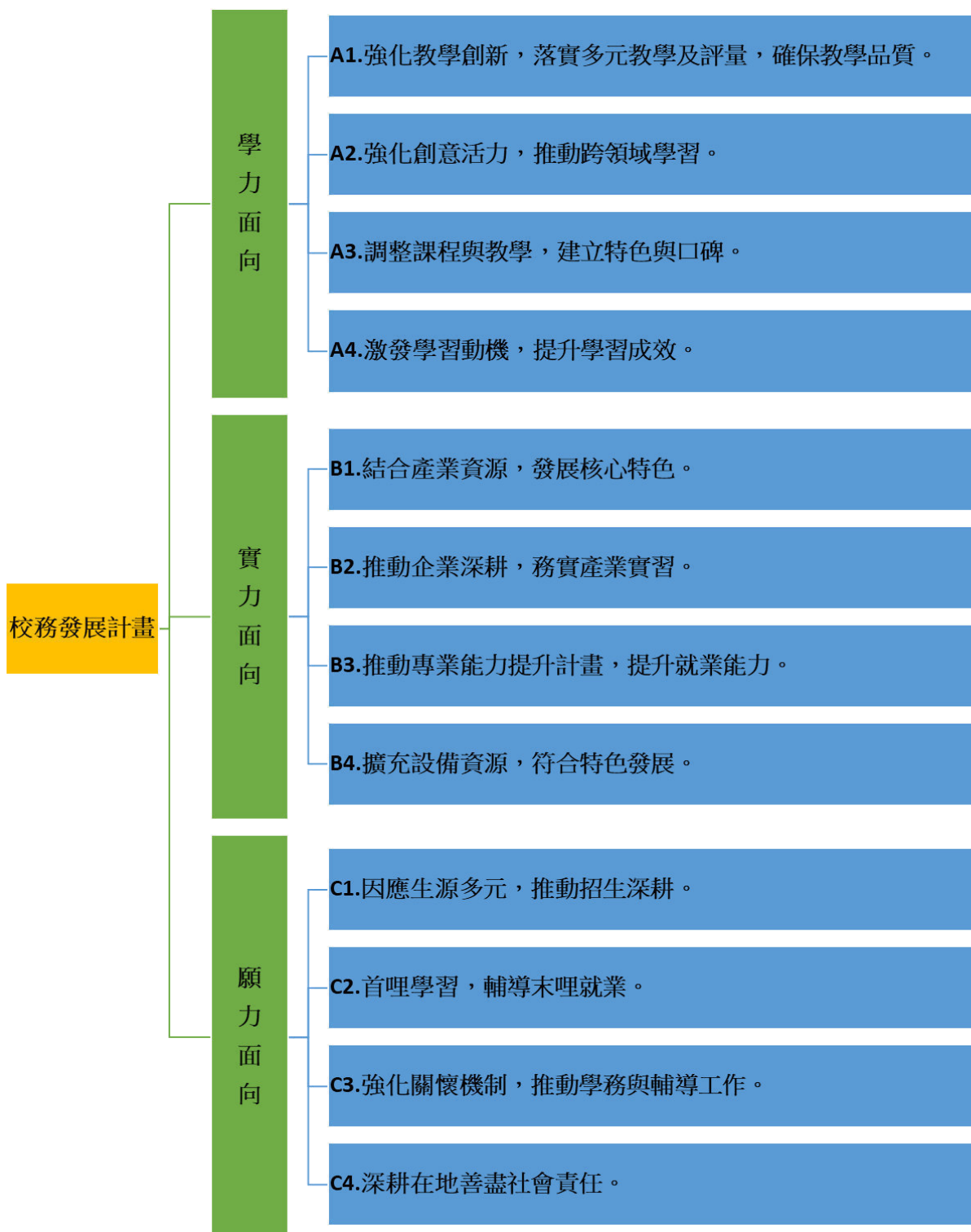
圖1-4 校務發展計畫架構圖