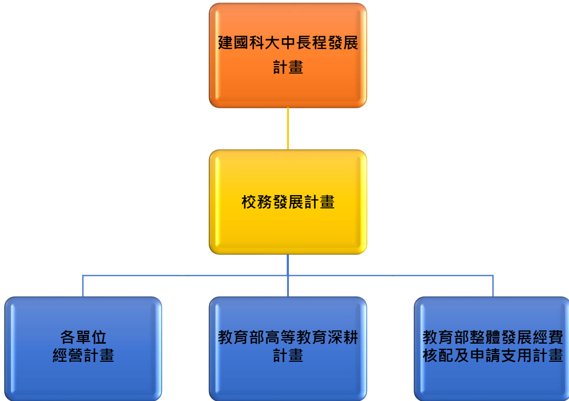
圖1-3 校務發展計畫執行架構

為落實推動校務發展，將結合「教育部高等教育深耕計畫」、及「教育部整體發展經費核配及申請支用計畫」，並以中長程校務發展計畫為依歸(如圖 1-3)。